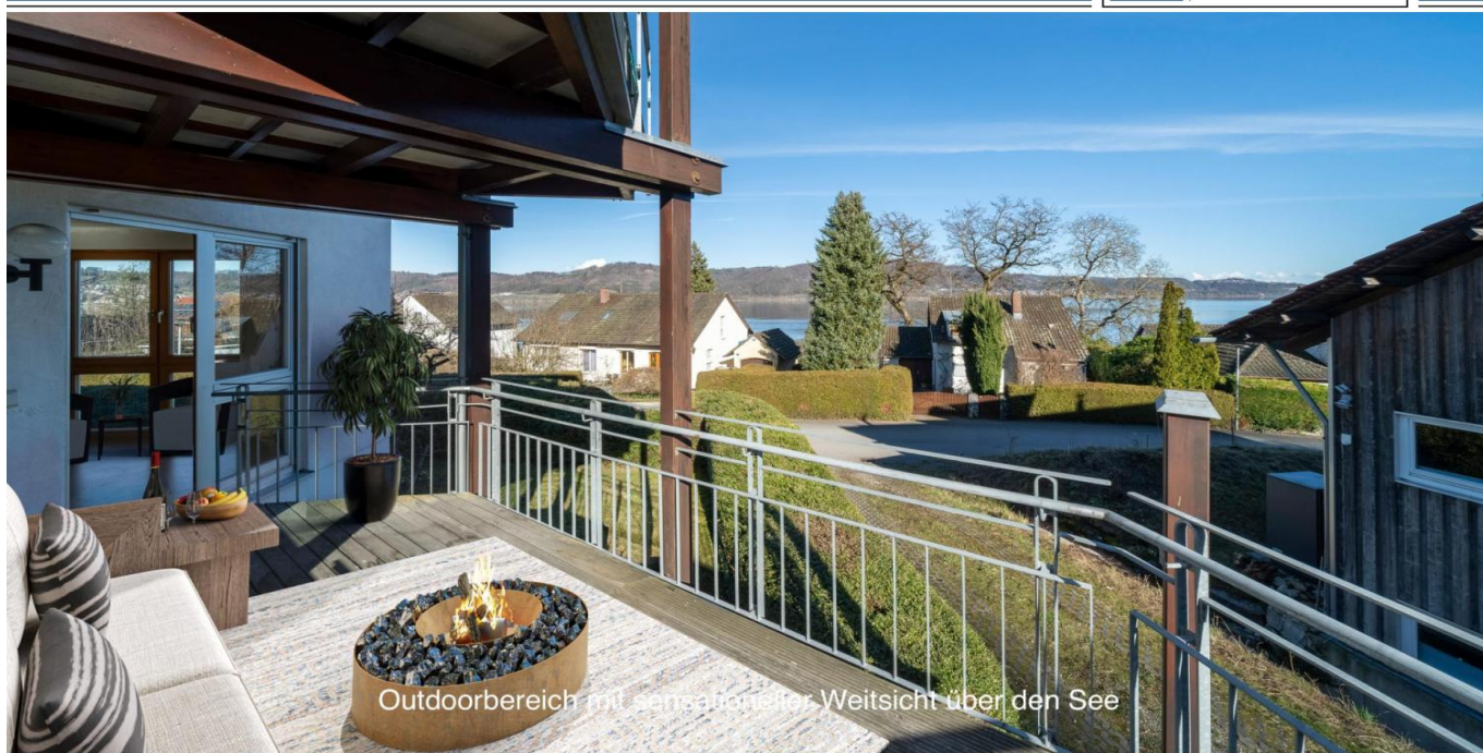
Outdoorbereich mit sensationeller Weitsicht über den See