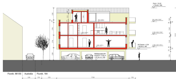
Schnitt 1-1 mit Flachdach im Bereich der Wohnungseingänge im DG