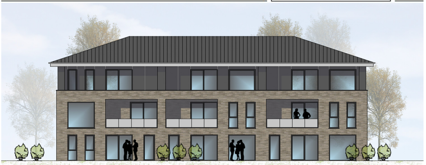
HAUS 3 ANSICHT VON WESTEN | M100