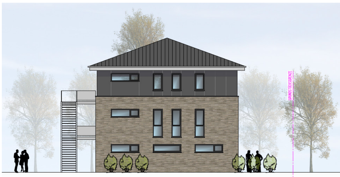
HAUS 3 ANSICHT VON NORDEN | M100