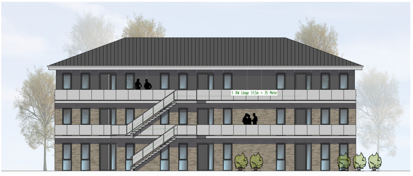
HAUS 3 ANSICHT VON OSTEN | M100