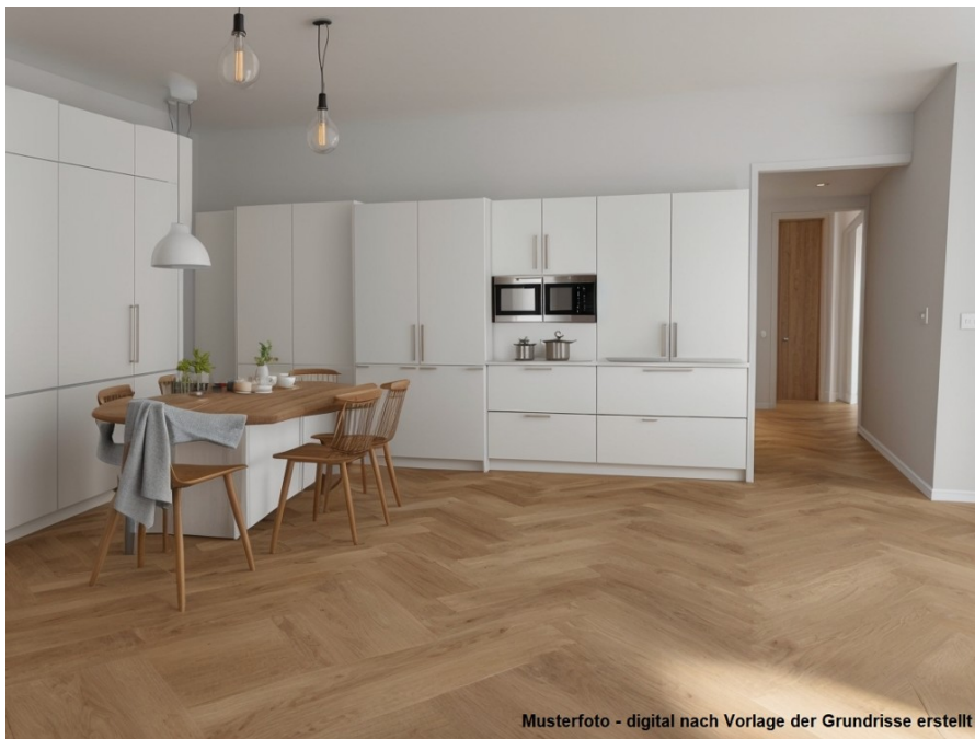
Musterfoto - digital nach Vorlage der Grundrisse erstellt