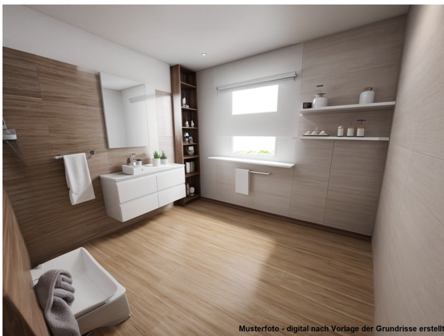
Musterfoto - digital nach Vorlage der Grundrisse erstellt