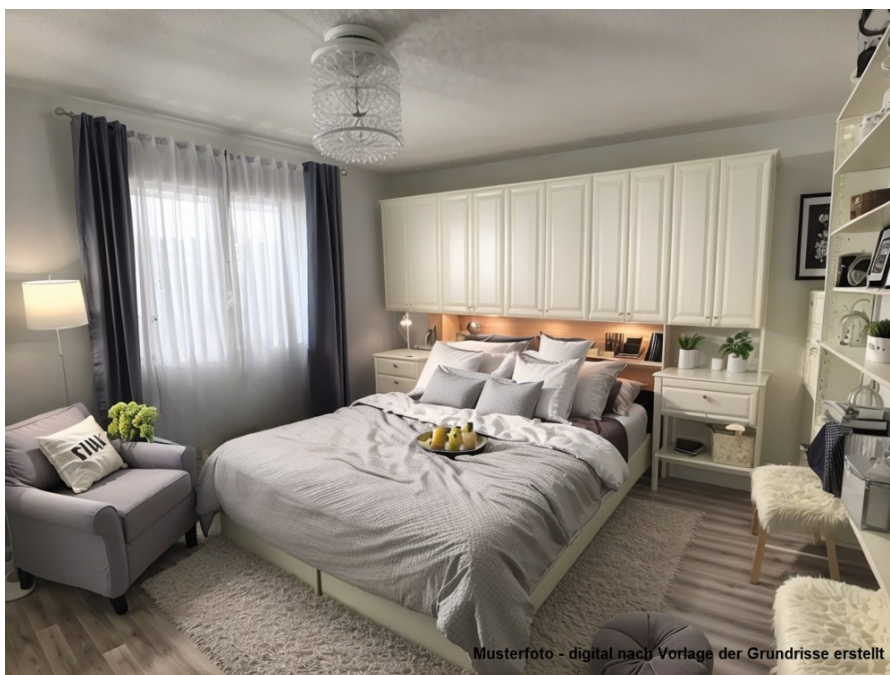
Musterfoto - digital nach Vorlage der Grundrisse erstellt