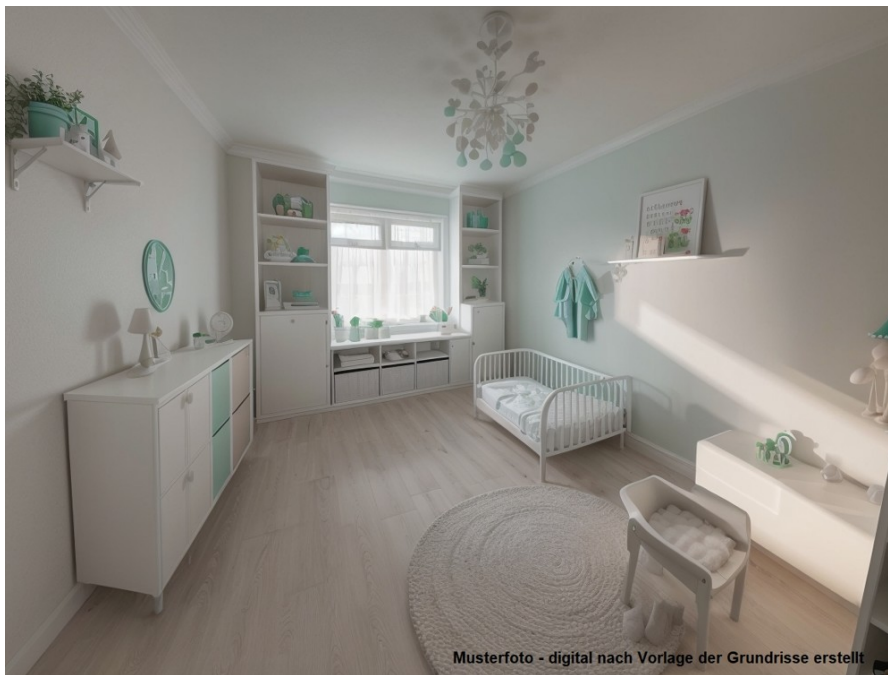
Musterfoto - digital nach Vorlage der Grundrisse erstellt