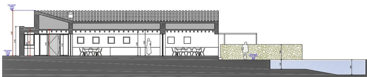
SECCIÓN 1 E: 1/50