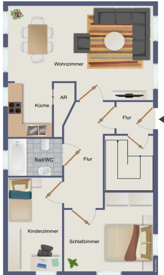
Erdgeschoss Dorfstr 29 a