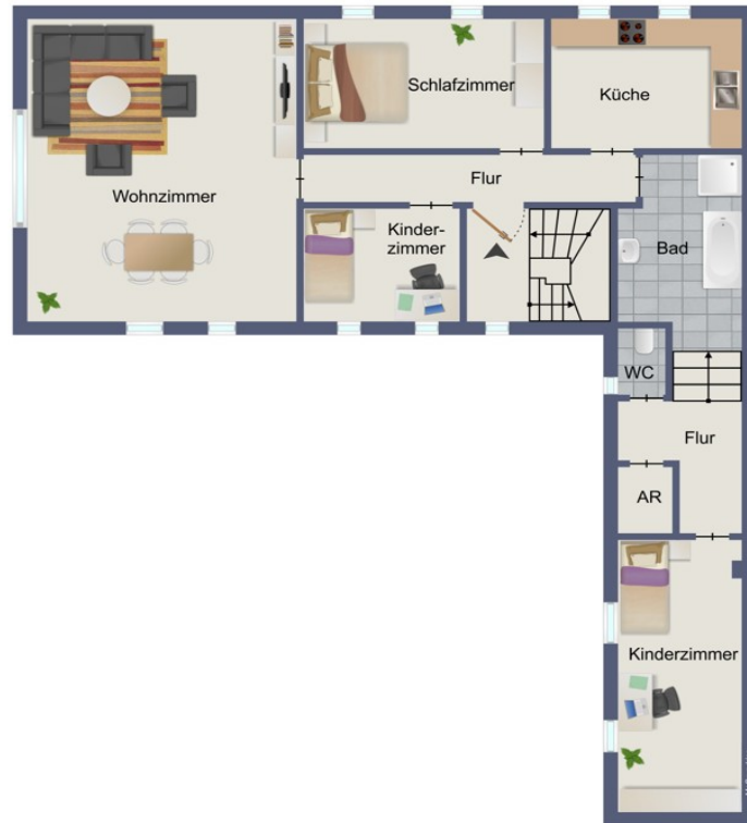
Obergeschoss Dorfstr 29