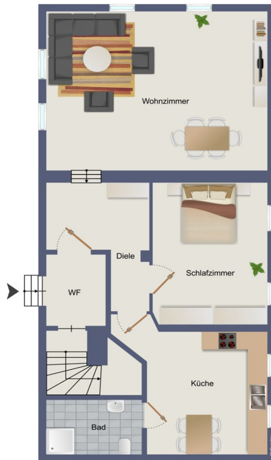
Erdgeschoss Dorfstr 29