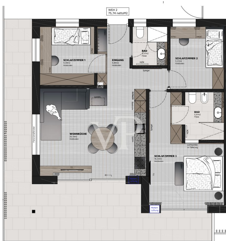
Grundriss Wohnung 02 Dachgeschoss M 1:50

Este plano no está a escala. Los documentos nos fueron entregados por el cliente. Por esta razón, no podemos garantizar la exactitud de la información.