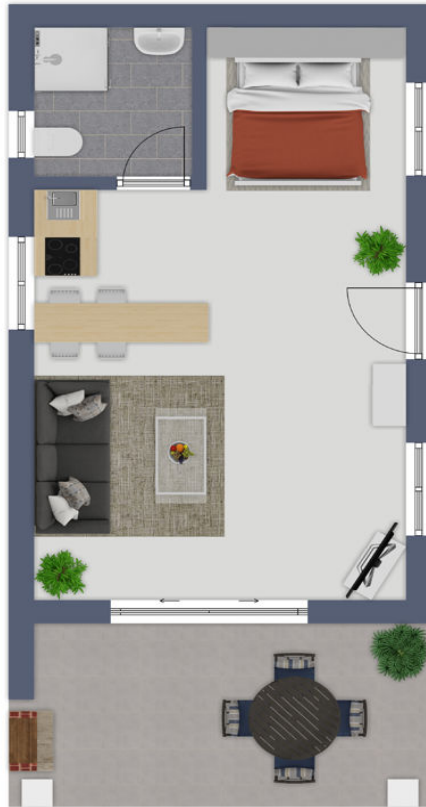
Exposéplan, nicht maßstäblich