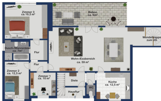
Exposé plan, nicht maßstäblich