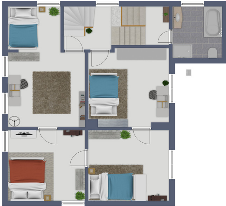
Exposéplan, nicht maßstäblich