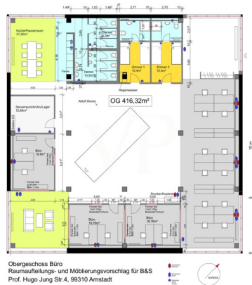
Obergeschoss Büro Raumaufteilungs- und Möblierungsvorschlag für B&S Prof. Hugo Jung Str.4, 99310 Arnstadt