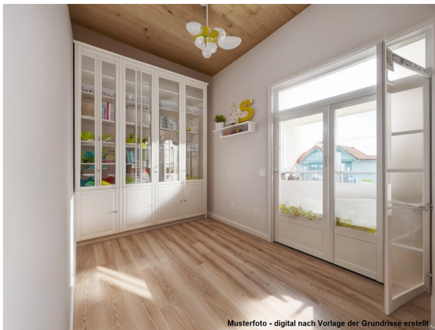
Musterfoto - digital nach Vorlage der Grundrisse erstellt