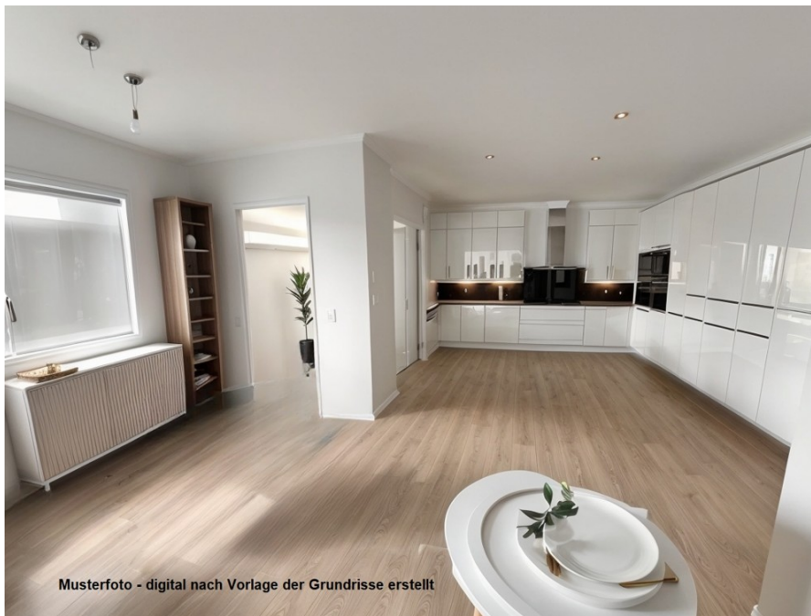
Musterfoto - digital nach Vorlage der Grundrisse erstellt