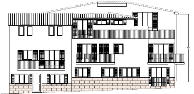
FACADA (E) (E)