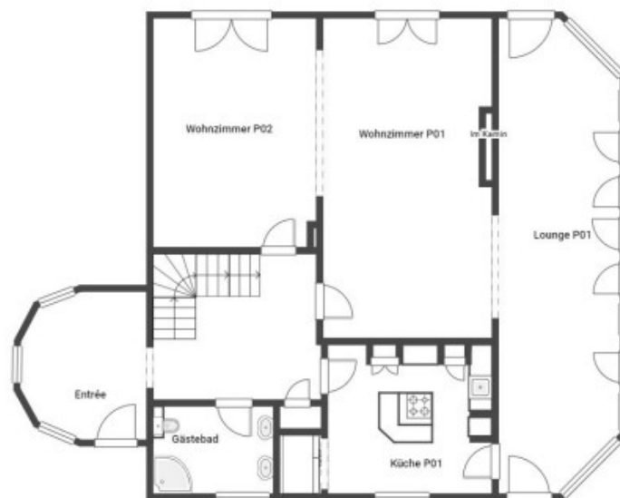
Erdgeschoss inkl. Atelier