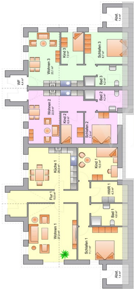
Grundriss EG Nebengebäude