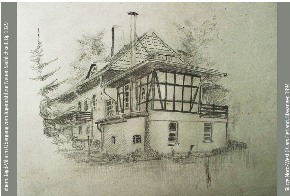
ehem. Jagd-Villa im Übergang vom Jugendstil zur Neuen Sachlichkeit, Bj. 1929