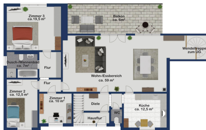
Exposé plan, nicht maßstäblich