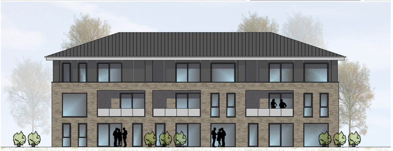
HAUS 3 ANSICHT VON WESTEN | M100