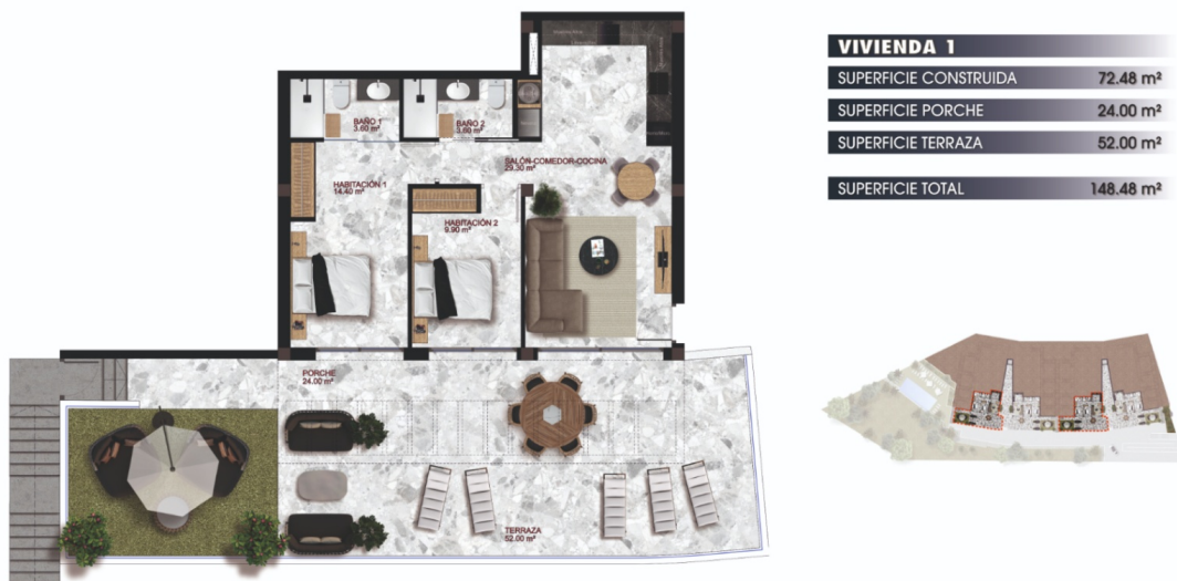
VIVIENDA 1 - PLANTA PISO 1 (1/75)