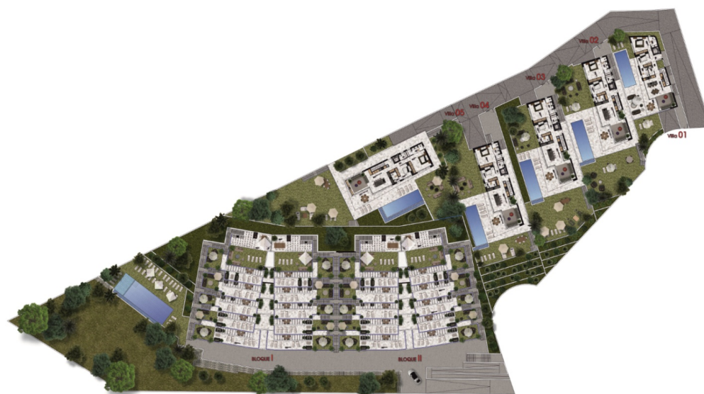
PLANTA GENERAL (1/500)