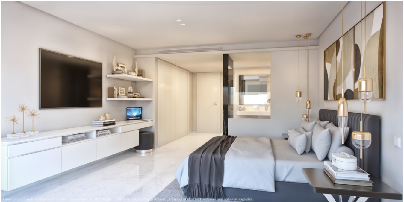
Finishes and furniture shown in the image are used for illustrative purposes. Consult your Sales Advisor in respect of standard materials and optional upgrades.