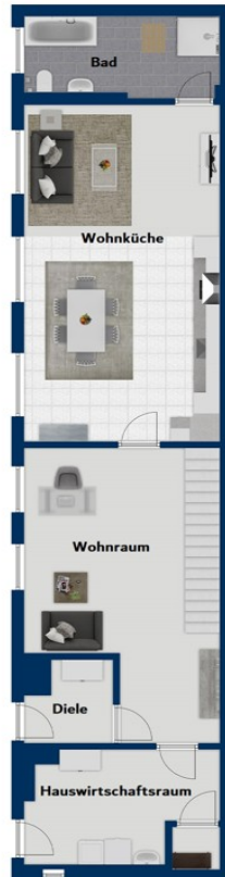
Grundriss Erdgeschoss HH