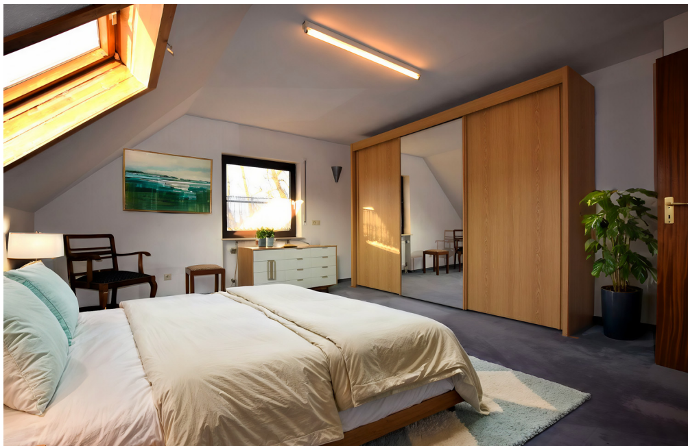
Unverbindliche virtuelle Projektion von IACrea