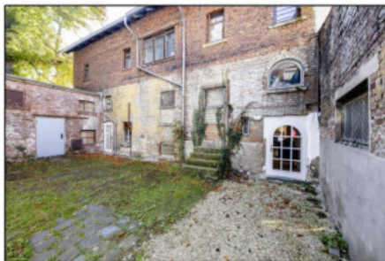
Gemeinsamer Innenhof zur Bruchstraße 4