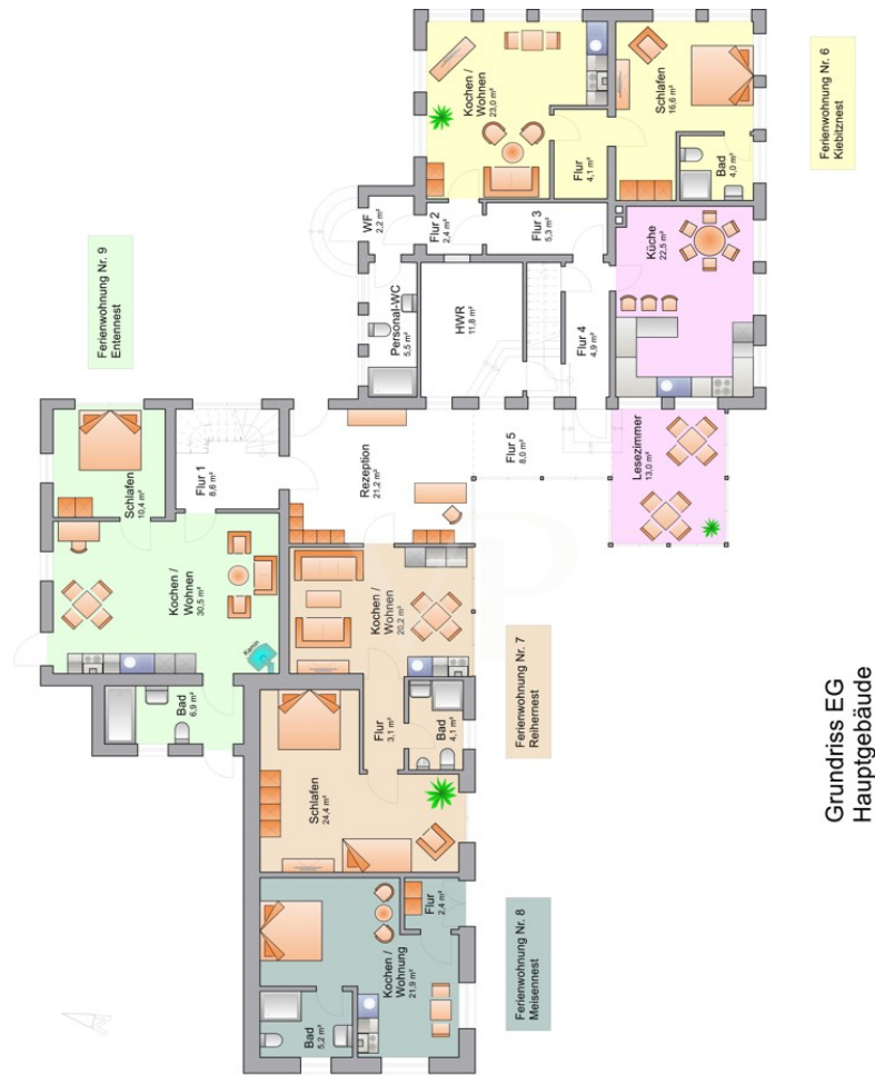
Grundriss EG Hauptgebäude