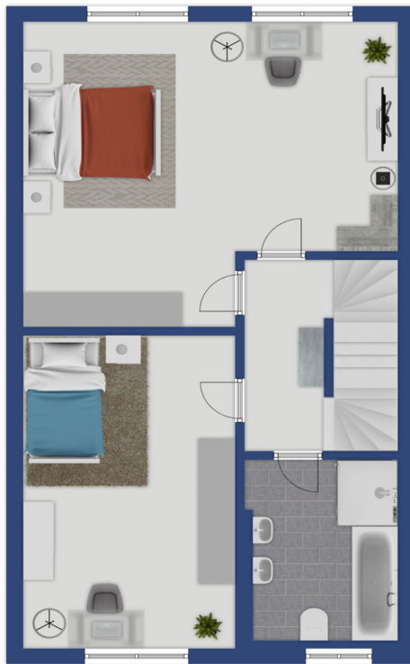
Exposéplan, nicht maßstäblich