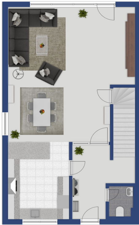
Exposéplan, nicht maßstäblich