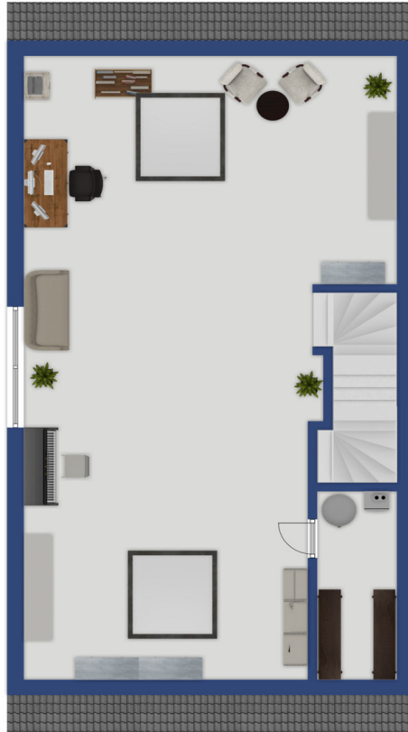
Exposéplan, nicht maßstäblich

Dieser Grundriss ist nicht maßstabsgetreu. Die Unterlagen wurden uns vom Auftraggeber zur Verfügung gestellt. Aus diesem Grund können wir nicht für die Richtigkeit der Angaben garantieren.