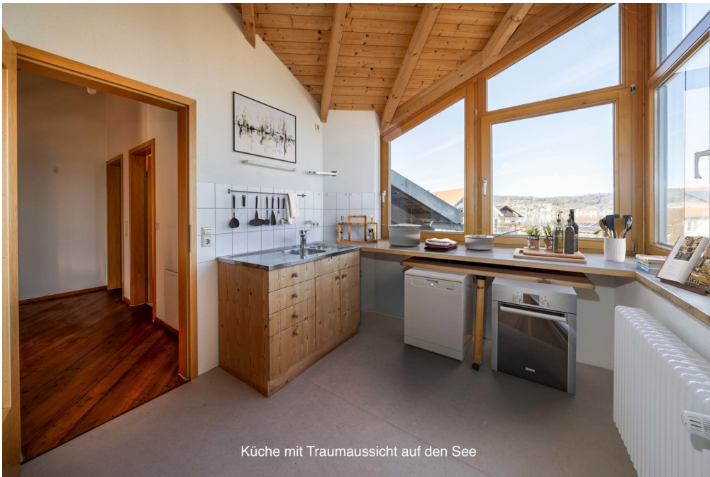
Küche mit Traumaussicht auf den See