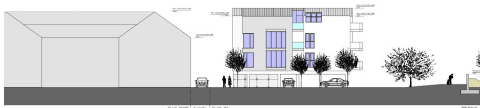
rd-West ≈ 20°/20°