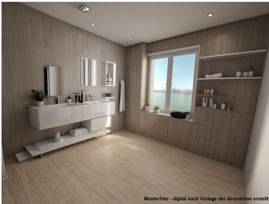
Musterfoto - digital nach Vorlage der Grundrisse erstellt