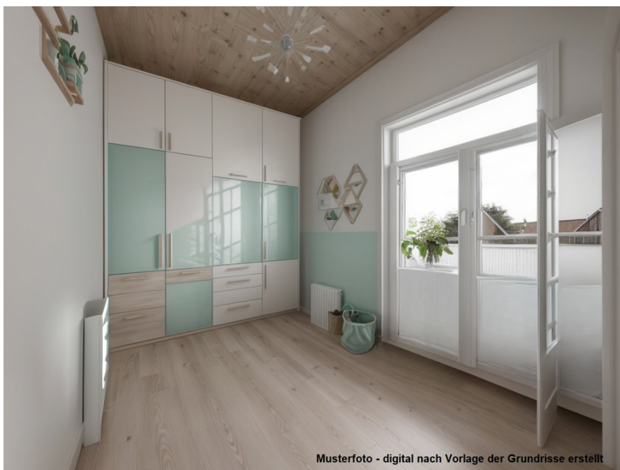
Musterfoto - digital nach Vorlage der Grundrisse erstellt