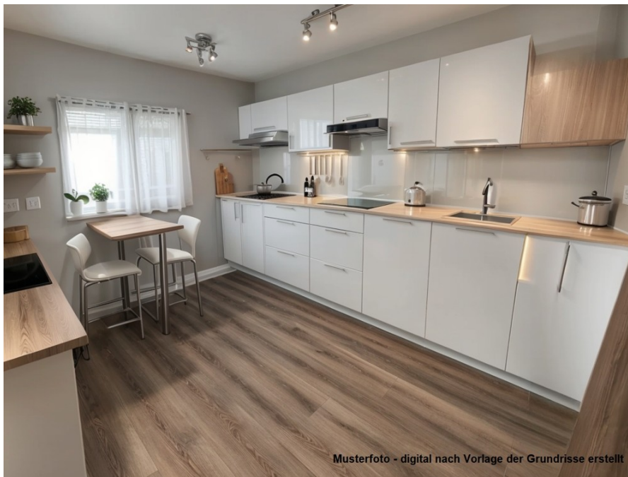
Musterfoto - digital nach Vorlage der Grundrisse erstellt