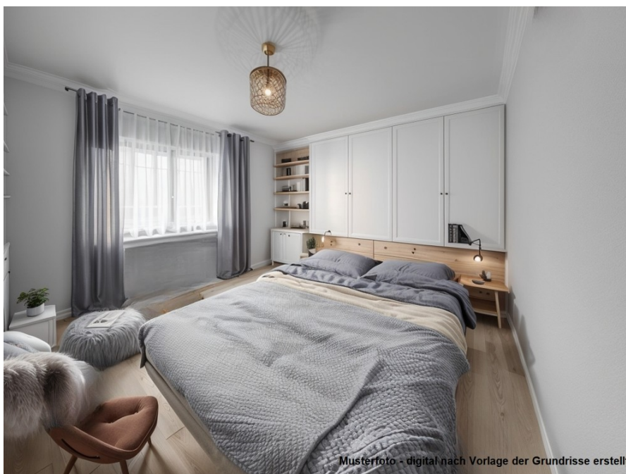
Musterfoto - digital nach Vorlage der Grundrisse erstellt