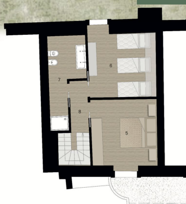
Piano Primo - Villetta 5