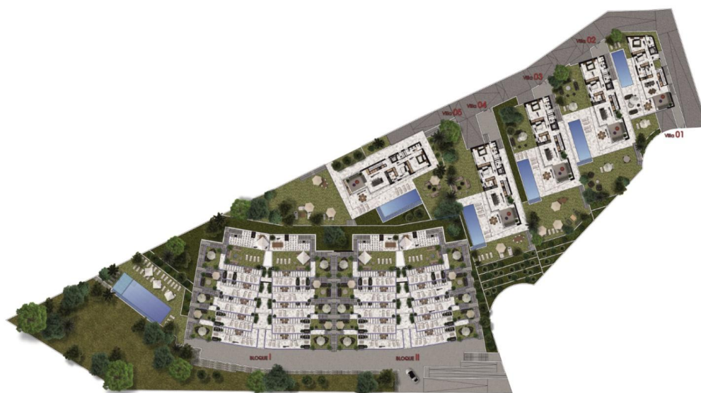
PLANTA GENERAL (1/500)