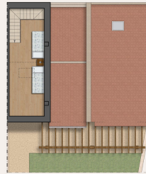
PIANTA PIANO SOTTOTETTO Sca. 1:100

Dieser Grundriss ist nicht massstabsgetreu. Die Unterlagen wurden uns vom Auftraggeber zur Verfügung gestellt. Aus diesem Grund können wir nicht für die Richtigkeit der Angaben garantieren.