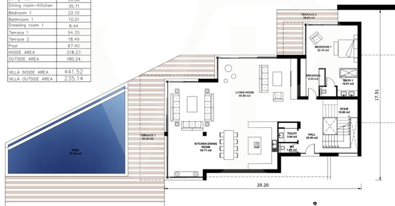
JARDINES DE IBERIS II. VILLA 9