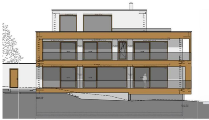
WEINBÖHLÄ Traumgrundstück mit Weitsicht