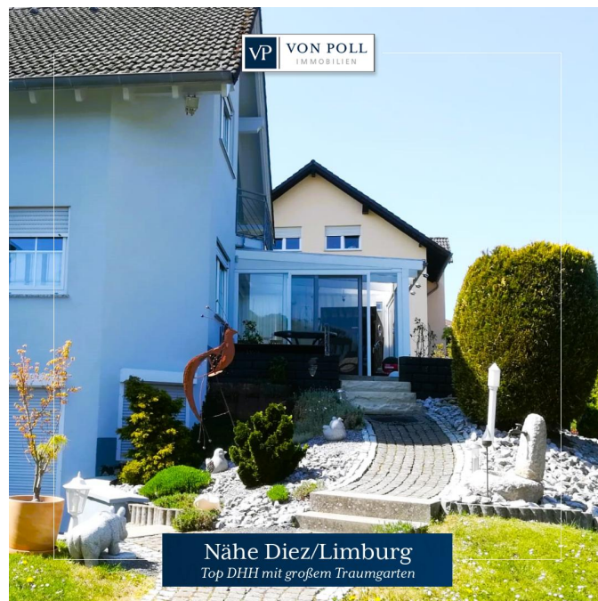
Nähe Diez/Limburg Top DHH mit großem Traumgarten