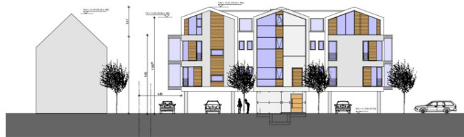
Ansicht Nord-Ost Variante 20°/20°