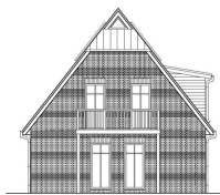
Ansicht Süd Villa Hafenkicker