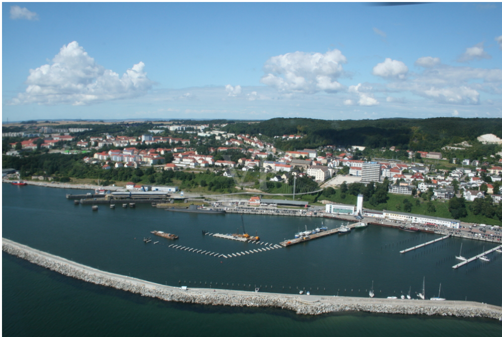
Neubau Apartment Hotel