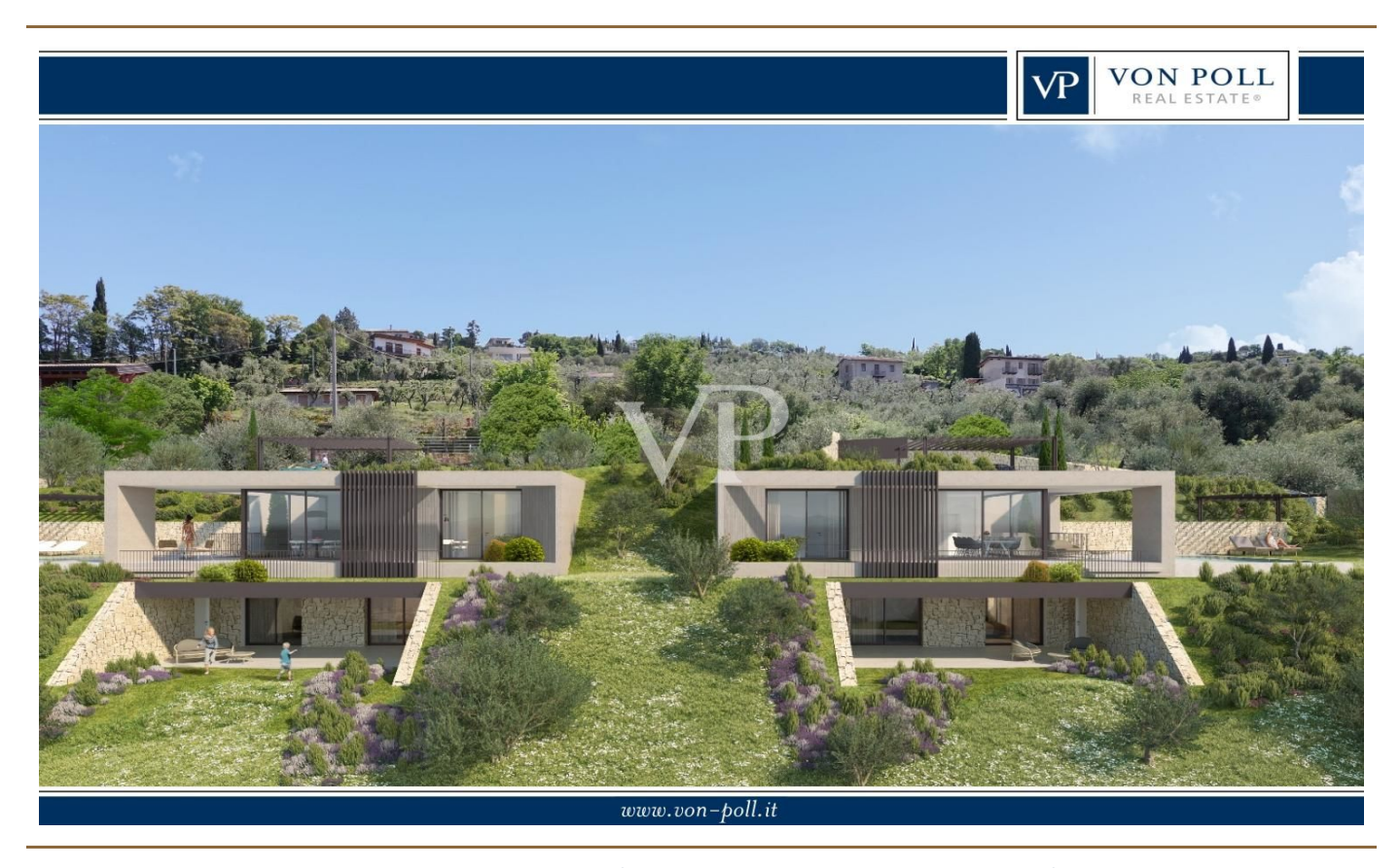
WOHNFLÄCHE: ca. 196 m<sup>2</sup> • ZIMMER: 7 • GRUNDSTÜCK: 400 m<sup>2</sup>