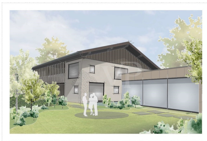
Perspektive - Fassadenstudie_V3