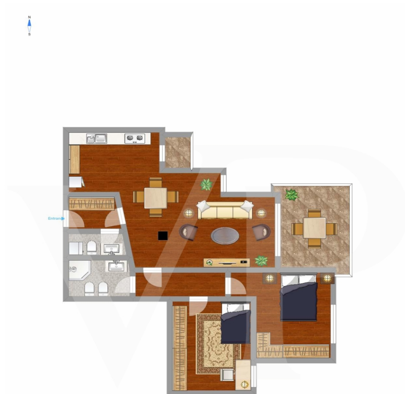
Apartment 3° Floor

Dieser Grundriss ist nicht maßstabsgetreu. Die Unterlagen wurden uns vom Auftraggeber zur Verfügung gestellt. Aus diesem Grund können wir nicht für die Richtigkeit der Angaben garantieren.