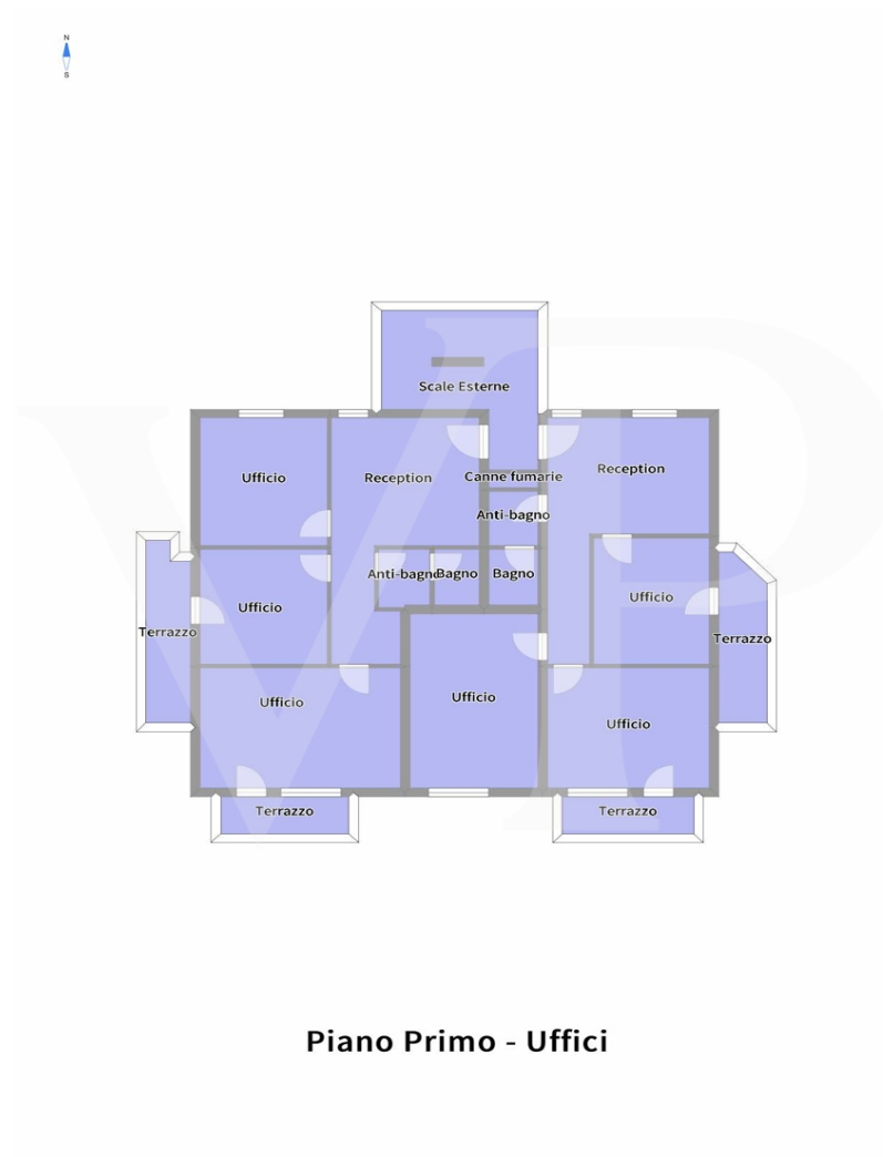
Piano Primo - Uffici