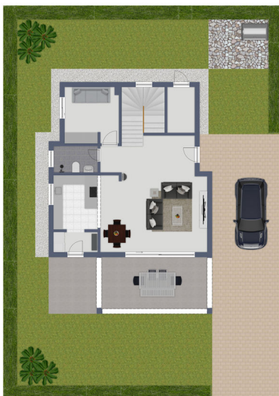
Exposplan, nicht maßstäblich