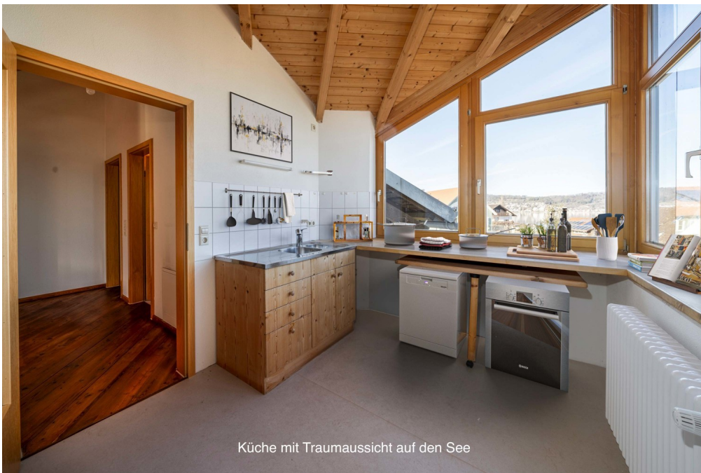
Küche mit Traumaussicht auf den See